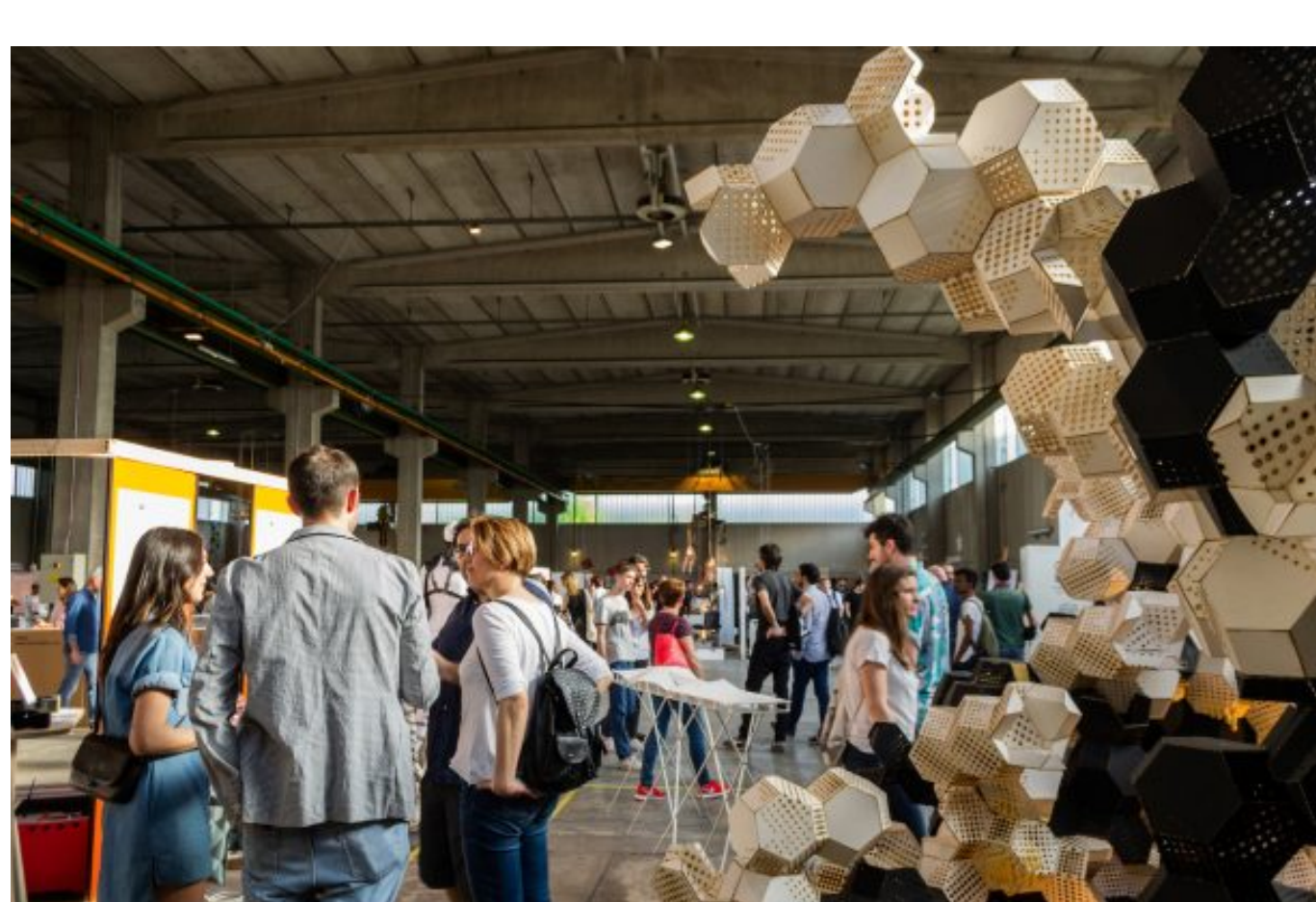
Din - Design-In, nella location di via Massimiano 6 / via Sbodio 9

Non perdetevi il "Rooftop" di via Ventura 15 . Un loft con terrazzo piantumato e piscina dal quale si gode di una meravigliosa vista sull'ex area industriale. Quest'anno questo strepitoso attico propone Panoramix , un connubio tra arte, design, musica e cibo. Il rooftop sarà aperto fino a tarda sera con una programmazione artistica che prevede anche performance, djset e live music.